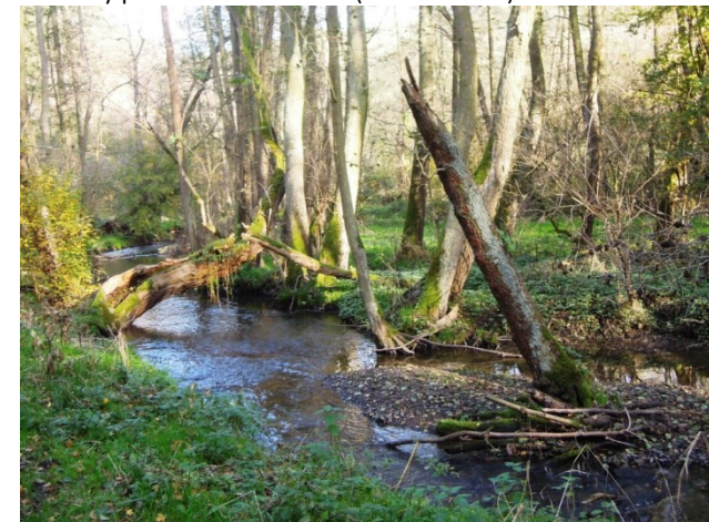
Únětický potok v Tichém údolí

Pro cyklisty je přímé spojení do metropole poněkud složitější, protože po levém břehu Vltavy vede do Prahy úzká a poměrně frekventovaná silnice, která však na hranicích města, v Sedleci, navazuje na cyklostezku s cyklotrasou A1. Příjemnější je použít přívoz do Klecánek a pokračovat po pravém břehu Vltavy a po cyklotrase A2.